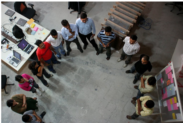
Abbildung: It's Not Just Standing Up 3